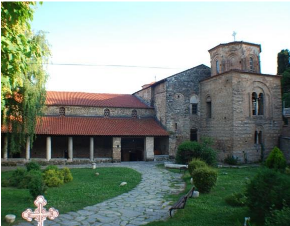
Црквата „Света Софија“ во Охрид