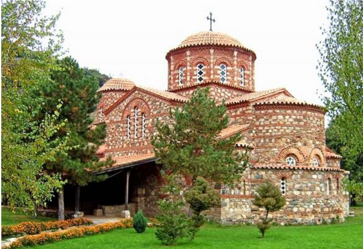
Манастирот Водоча во Струмица

мултикултурната политика, македонските иселеници, со голем ентузијазам и полет ги негуваат своите народни традиции; го презентираат својот богат фолклор, потоа на јавни места ги пеат своите народни песни и ги играат убавите македонски ора. Всушност, во новите средини тие го афирмираат македонското име, културно-историското минато и сегашноста.