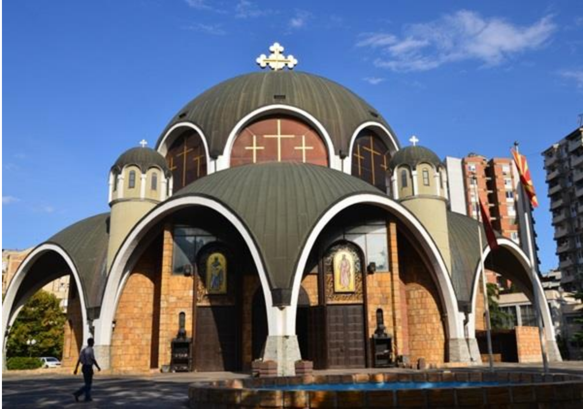
Соборниот храм „Свети Климент Охридски“ во Скопје

Некои пореални процени зборуваат дека, покрај македонското население во Македонија (1.378.687) - според пописот во 1994 година), во Бугарија живеат повеќе од 300.000 Македонци, во Грција околу 250.000, во Албанија повеќе од 150.000, а во Србија и Црна Гора околу 100.000 Македонци. Исто така, се проценува дека од средината на XIX век па до денес, од сите делови на Македонија, во разни земји во светот се преселиле од 600 до 700 илјади Македонци.