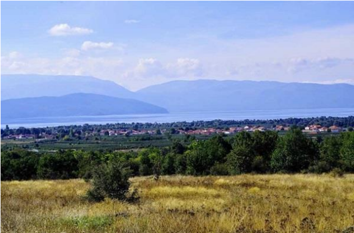
Селото Наколец во Преспа