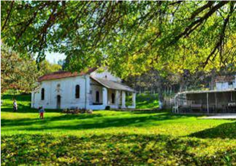
Манастирот Христофор кај Крстоар

татковината и во Канада. Во првата нејзина книга се собрани повеќето нејзини досегашни напишани песни од кои не е тешко да се заклучи дека станува збор за една автентична поетска мисла и оригинална идеја.