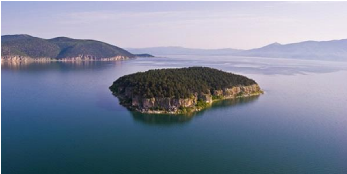
Островот Голем Град во Преспа