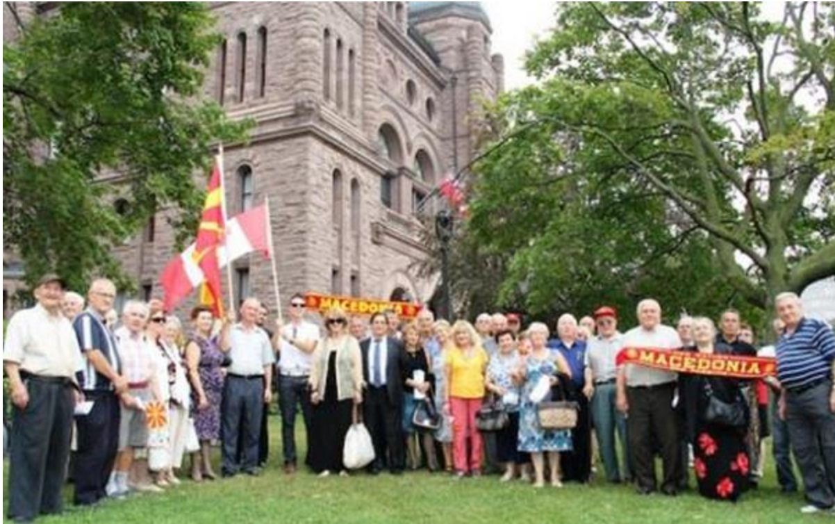
Со македонското знаме пред парламентот во Торонто

Една од првите задачи на Комитетот беше да се запознае јавноста со неговите цели и задачи; со барањето на Комитетот за почитување на човечките права на Македонците во Егејска Македонија, а во прв ред, за признавање на македонското национално малцинство во Грција. „Македонскиот комитет за човековите права“ дејствува надвор од границите на Македонија, со што македонското прашање доби светски размери, а посебно прашањето за заштитата на правата на малцинствата во Грција, Бугарија и Албанија.