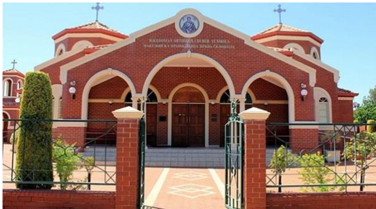
Црквата „Свети Никола“