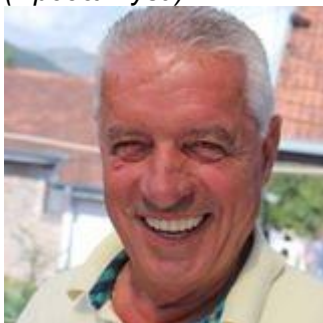
Пишува: СЛАВЕ КАТИН