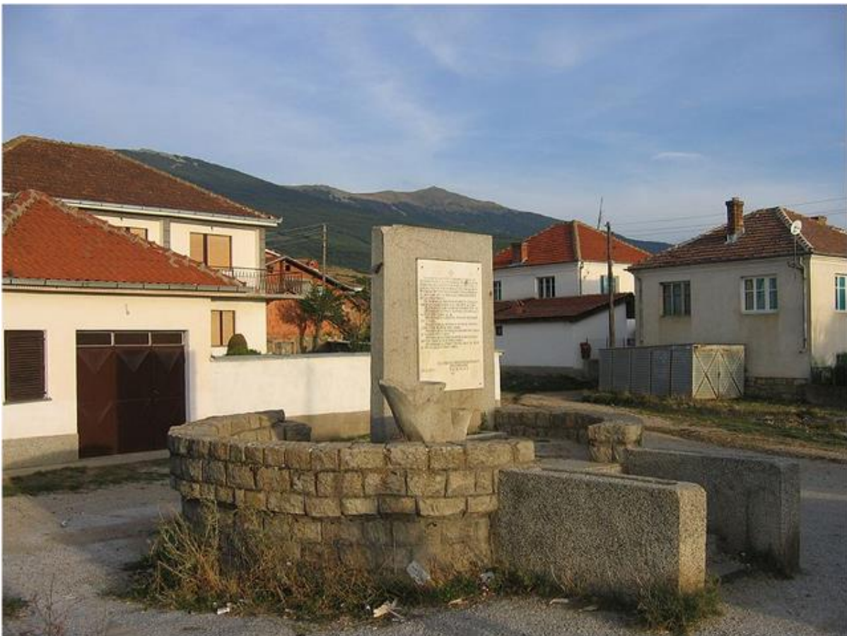
Центарот на Подмочани

На тоа свето македонско место, во Охајо, каде што е изградена сала за 500 лица, се одржуваат пикници и други манифестации, а до неа е црквата „Свети Никола“, чиј камен-темелник бил осветен на 17 септември 1989 година од архиепископот господин господин Гаврил. Осветувањето на црквата е извршено на 13 септември 1998 година од владиката Кирил.