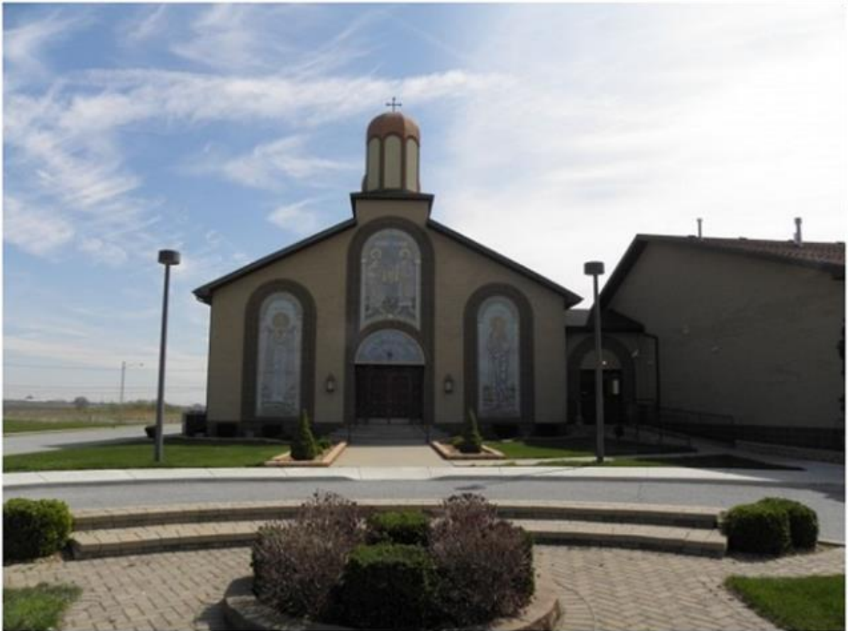
Црквата „Свети Петар и Павле“ во Краунт Поинт, Индијана

Македонските православни цркви во САД се најзначајните и најмасовните собиралишта на Македонците од сите делови на Македонија. Во тие македонски храмови, покрај богослужбата, слободно се слуша македонскиот збор, мајчиниот јазик донесен од стариот крај. Притоа, македонските православни цркви опстојуваат во дијаспората како несоборлива вистина, како важен фактор во иселеничките средини. Црквите постојат како траен белег, признати се од домашниот фактор и без никакви пречки дејствуваат во средината во која живеат и работат Македонци.