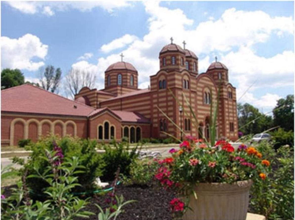
Црквата „Успение на Пресвета Богородица“ во Колумбос, Охајо